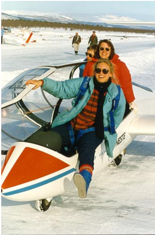
Kaksi naista koneessa, missä on kuljettaja?